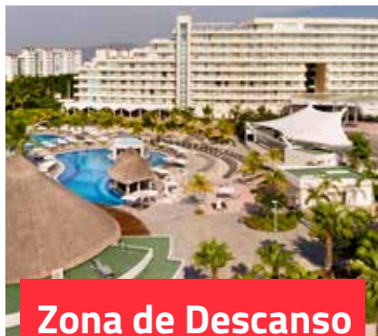
Zona de Descanso