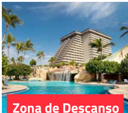
Zona de Descanso