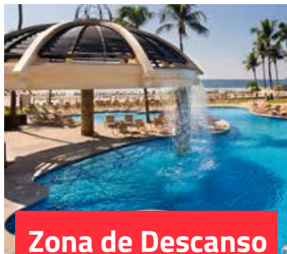
Zona de Descanso